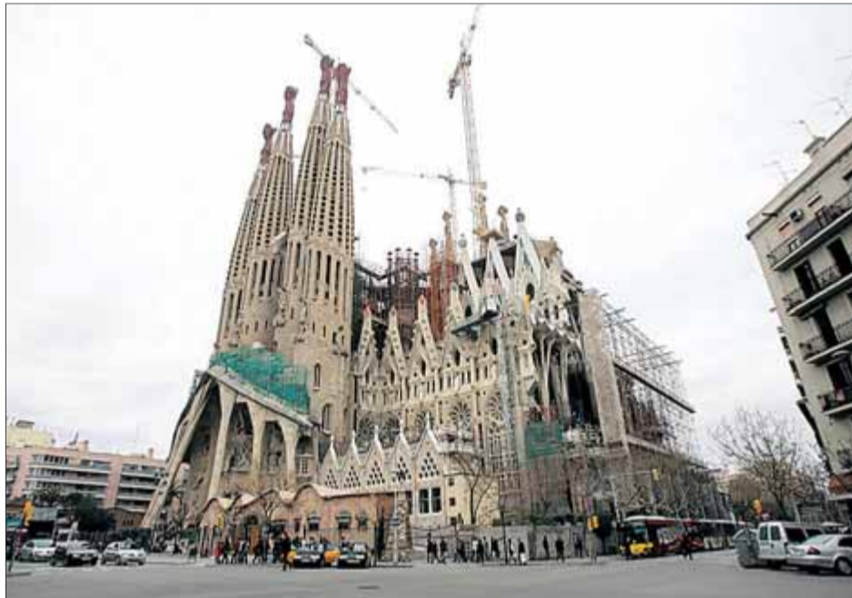
La Sagrada Família vista des de l'angle del carrer Sardanya amb Mallorca ■ MIQUEL ANGLARILL

Rigol, que es va confessar molt decebut, va recordar que la Sagrada Família és el monument més visitat de l'Estat, que és un símbol